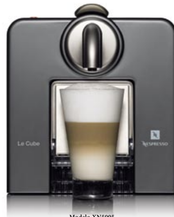
Modelo XN5005 Cubierta de aluminio con acabado de titanio Bandeja caliente tazas Color disponible: gris titanio

FOTOS: Stephen White/White Cube, Anonima Kirih/Sol LeWitt, Intentionalities/Shuwa Tei, Cassina I Maestri Collection/CCZ, Le Corbusier, P.leameret, C.Ferriand, Andreas Lobe/Zeitenspiegel/ CONTRAST/La Grande Arche