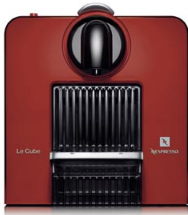
Modelo EN180R Cubierta con revestimiento de plástico doble Espacio para almacenar tazas Color disponible: rojo