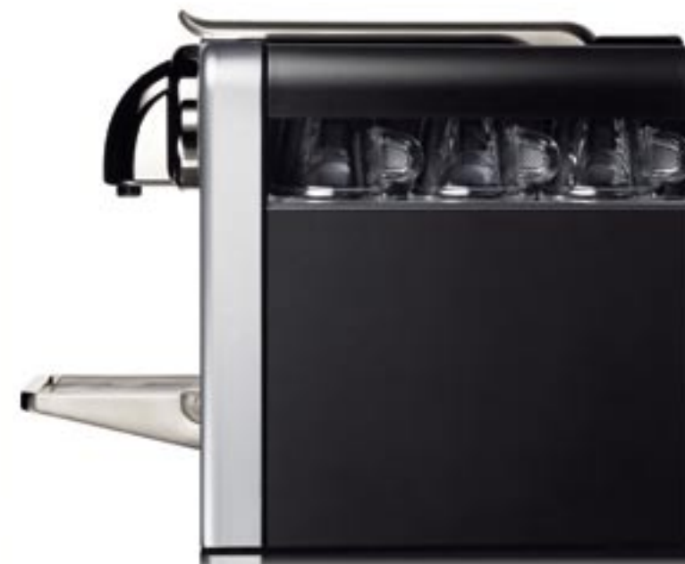
Modelo EN185M Cubierta de aluminio con acabado de titanio Bandeja caliente tazas Color disponible: aluminio