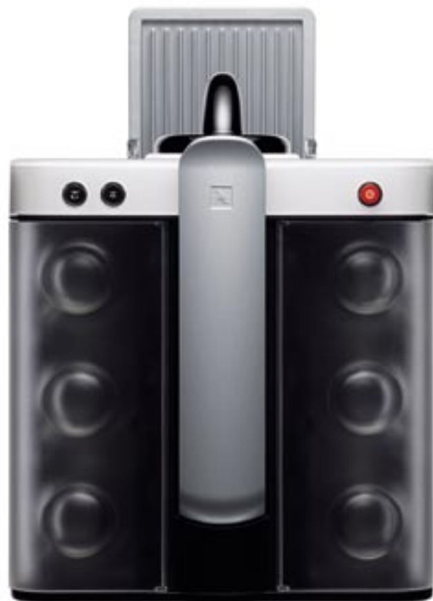
Modelo XN5000 Cubierta con revestimiento de plástico doble Espacio para almacenar tazas Color disponible: blanco