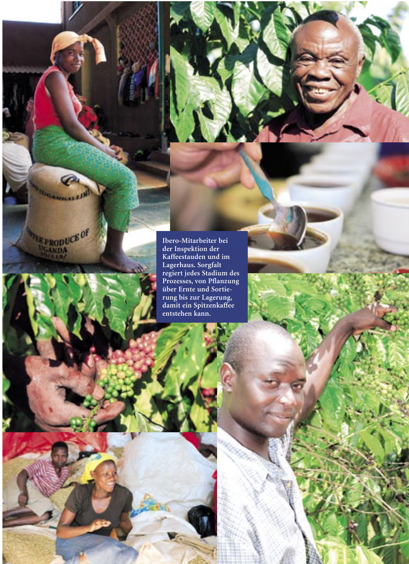
Ibero-Mitarbeiter bei der Inspektion der Kaffeestauden und im Lagerhaus. Sorgfalt regiert jedes Stadium des Prozesses, von Pflanzung über Ernte und Sortierung bis zur Lagerung, damit ein Spitzenkaffee entstehen kann.