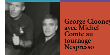
George Clooney avec Michel Comte au tournage Nespresso