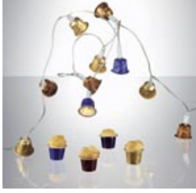
Für ihren Entwurf „Playful Leftover“ wurde Jet Scholte von der Design-Akademie Eindhoven mit einer „Besonderen Erwähnung“ ausgezeichnet.