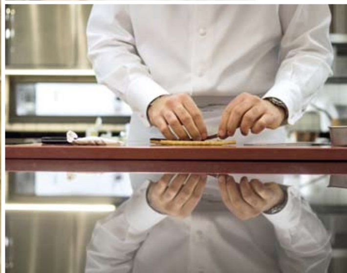
TEXTO: VICKY CHAHINE